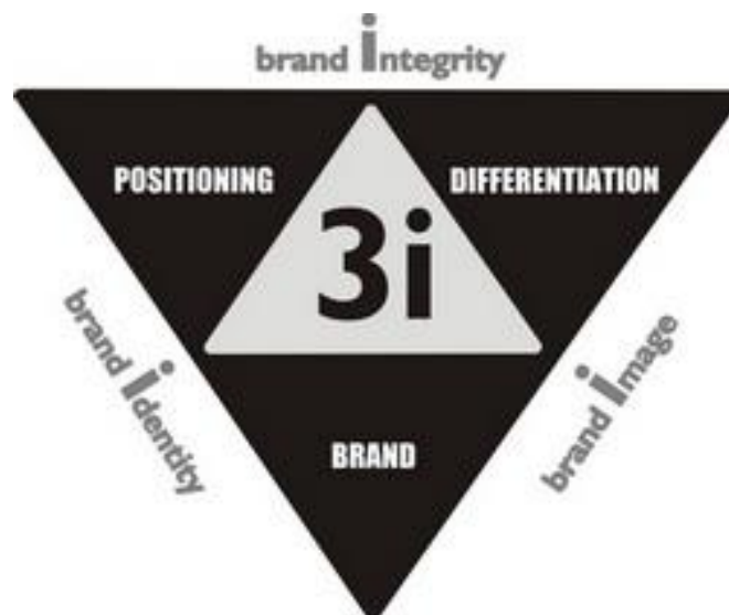
ภาพประกอบ 2 โมเดล 3i